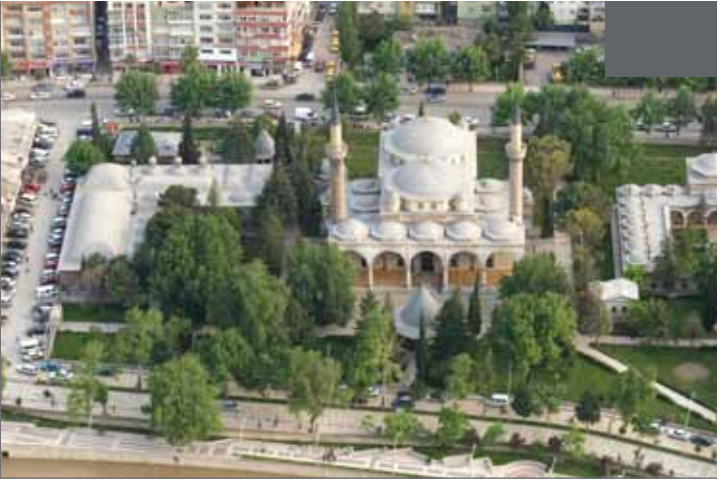
II. Bayezid Külliyesi